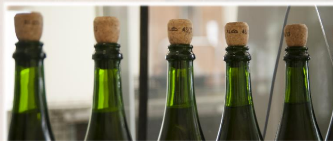
Embouteillage de Cerdon. Clos des Godardes®

Découvrez les viticulteurs membres d'Etik'table, sur www.etik'table.fr