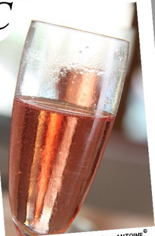
Verre de Bugey Cerdon, Véralique ANTOINE®