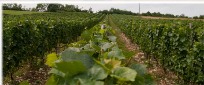
Parcelle de vigne AOC Cerdon. Domaine de la Bélière®

En orange, le territoire AOC Bugey, en rouge celui de l'AOC Bugey Cerdon sur la Communauté d'Agglomération du Bassin de Bourg-en-Bresse